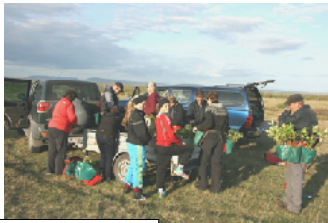
Vinnukvöld í Hellisskógi

Tvö vinnukvöld voru haldin í sumar, 11. og 13. júní þar sem félagsmenn mættu og gróðursetu u.þ.b. 2000 plöntur. Vinnukvöldin voru m.a. auglýst á heimasíðu félagsins www.hellisskogur.is og á dreifimiðum sem bornir voru út til félagsmanna. Mæting á vinnukvöldin var ágæt. Bæði kvöldin var veður gott milt og þurrt. Var gróðursett í gamla jarðvinnslu í NA hornið upp af Hellinum. Einnig var plantað birki og ösp á flöt NA við Hellirinn, skammt austan við þar sem malborinn vegur endar. Áburður var borin jafn óðum á nýgróðursetta plöntur.