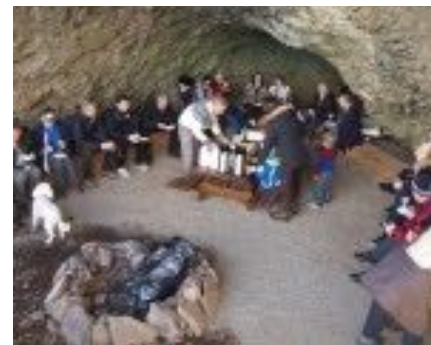
Afmæliskaffi í Hellisskógi. Mynd stolin af vefnum.

Í haust voru stunginn upp fjölmörg c.a 3 metra há birkitré úr væntanlegu vegstæði sem liggja á frá Biskupstungnabraut og inn í skóginn strax fyrir austan gömlu Hellisbrúnna. Fyrirhugað er að vegurinn verði malborinn í vetur.